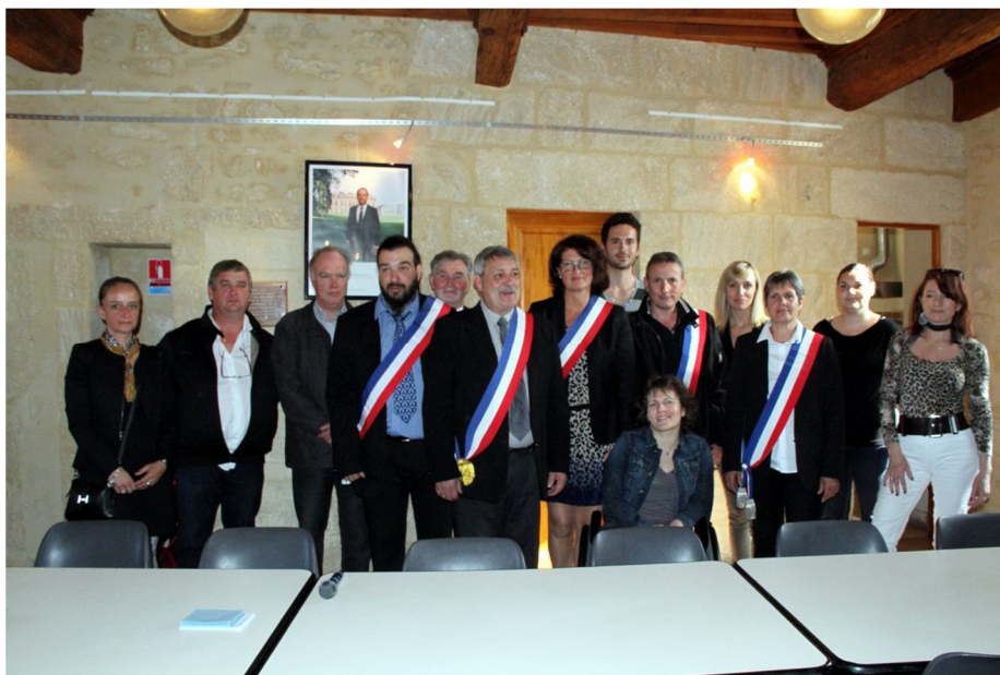
Nouvelle équipe municipale 5 avril 2014